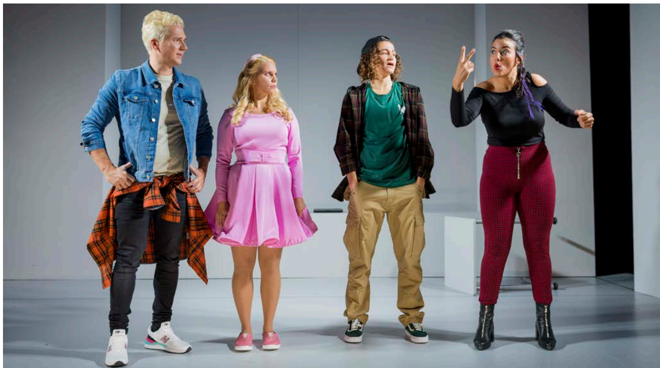
Riksteatern Crea ger föreställningar på teckenspråk, här pjäsen "Superhjältar".